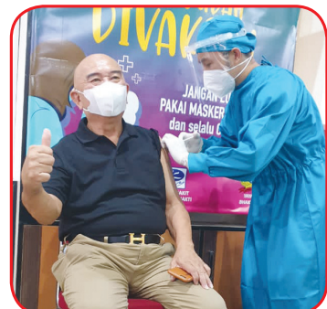
Salah seorang lansia divaksin.