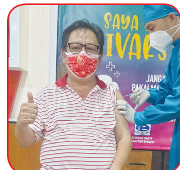
A Wei divaksin.