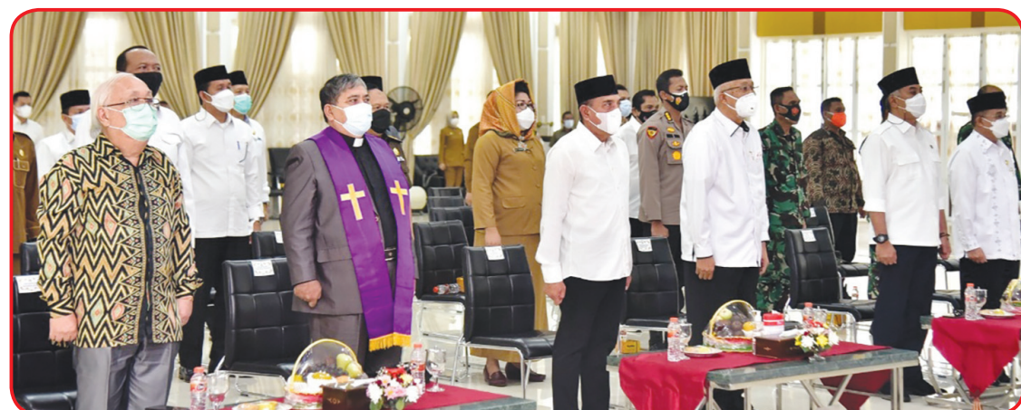
Gubernur Edy Rahmayadi bersama para tokoh yang hadir dalam acara doa bersama lintas agama.

tor Kementerian Agama di Provinsi Sumut dan tokoh lainnya. • idn/din