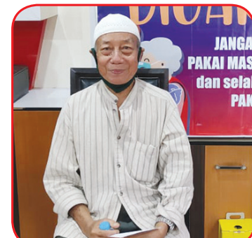
Salah seorang lansia divaksin.