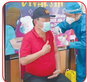
Salah seorang lansia divaksin.