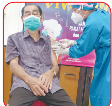
Salah seorang lansia divaksin.