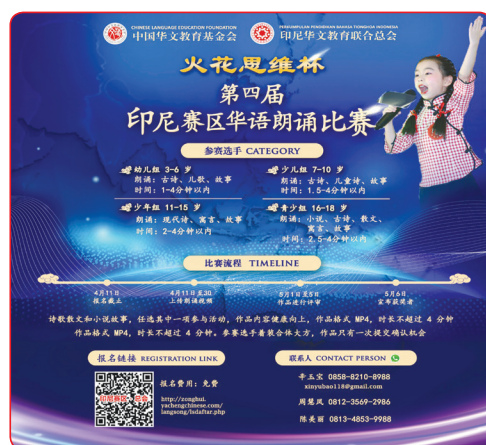
Banner The 4th Global Chinese Recitation Contest.

JAKARTA (IM) - Chinese Language Education Foundation sejak tahun 2018, setiap tahunnya menyelenggarakan Global Chinese