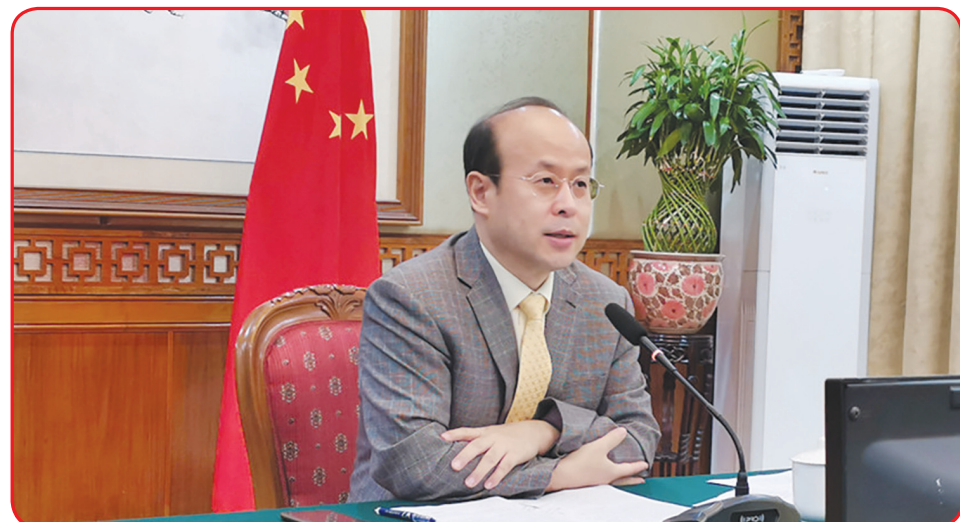
Dubes Tiongkok untuk Indonesia Xiao Qian.