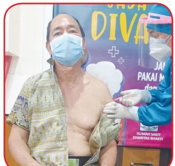
Salah seorang lansia divaksin.