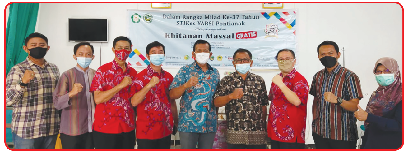
FOTO BERSAMA: Pengurus PSMTI Kalbar berfoto bersama pimpinan STIKes Yarsi Pontianak.