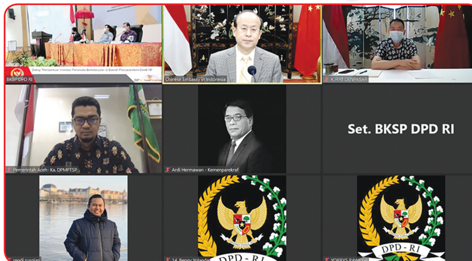
Peserta Dialog Tiongkok-Indonesia bertema "Memperkuat Investasi Pariwisata Lokal yang Berkelanjutan di Era Paska Pandemi".

JAKARTA (IM) - Dewan Perwakilan Daerah Republik Indonesia (DPD RI), Jumat (26/3) lalu, menyelenggarakan Dialog Tiongkok-Indonesia bertajuk Memperkuat Investasi Pariwisata Lokal yang Berkelanjutan di Era Paska Pandemi, di Bali.