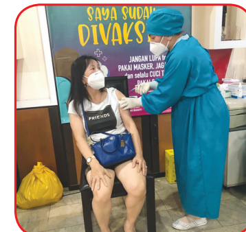
Salah seorang lansia divaksin.