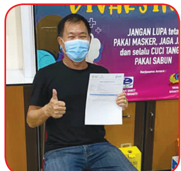
Salah seorang lansia divaksin.