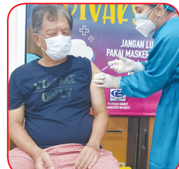
Salah seorang lansia divaksin.